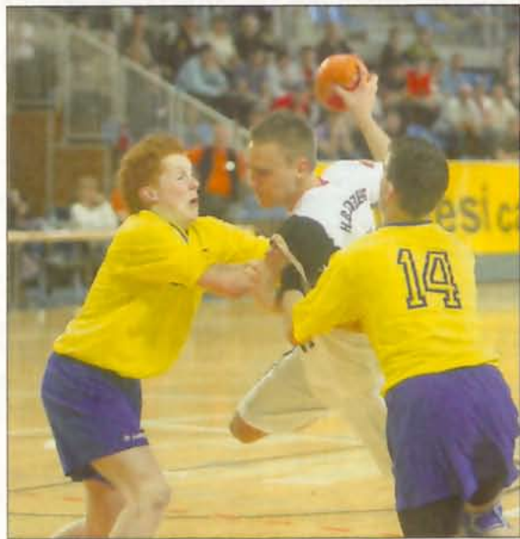
Le HBD a su percer la muraille des Néerlandais.