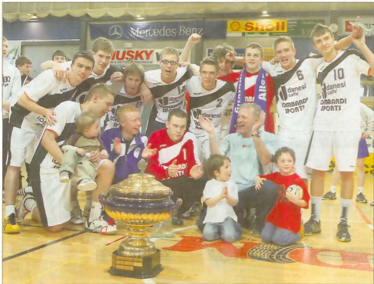
L'équipe qui a remporté le trophée pose pour la postérité. Quel beau week-end!

Les cadets du HB Dudelange ont su créer contre toute attente l'exploit de remporter pour la première fois ce tournoi international qui existe depuis 1987.