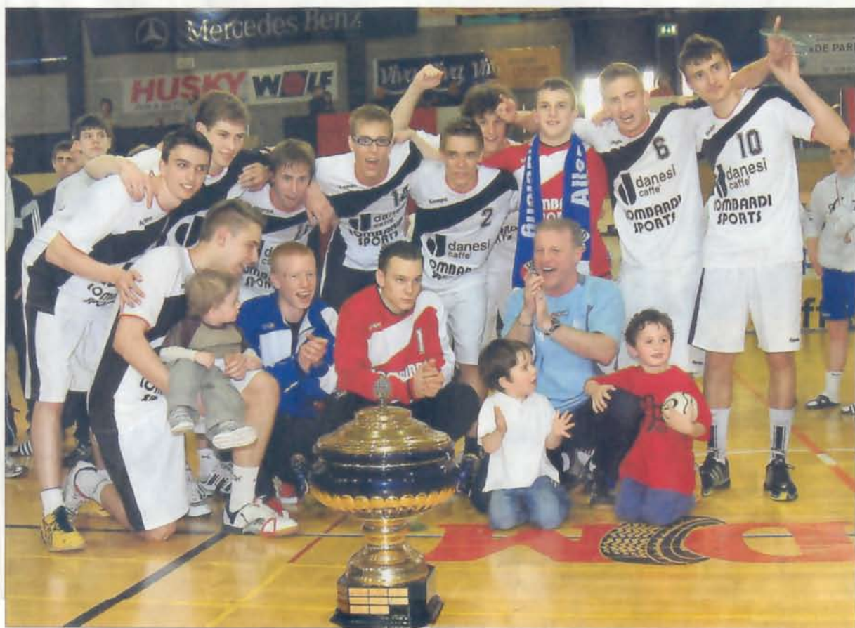
Erstmals bleibt der Pott in der „Forge du Sud“: der HB Düdelingen, Gewinner des Youth Cup 2007