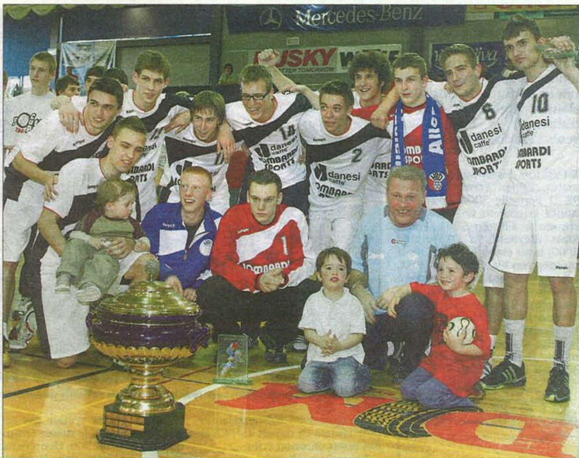
Une photo de famille qui restera dans les annales du club: le HBD et le trophée de la Youth Cup